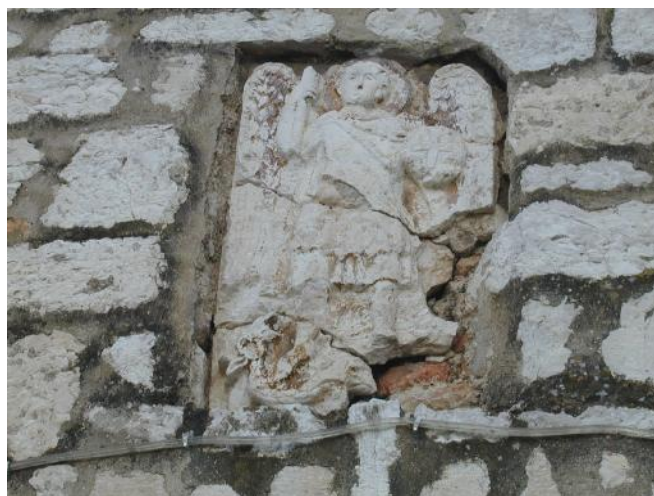
Stanje prije restauratorskih radova