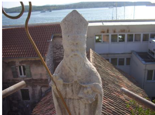
Kip sv. Nikole nakon restauracije