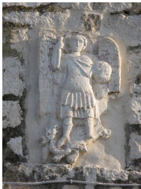
Nakon restauratorskih radova