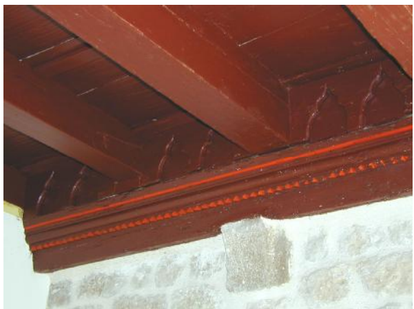
nakon restauratorskih radova