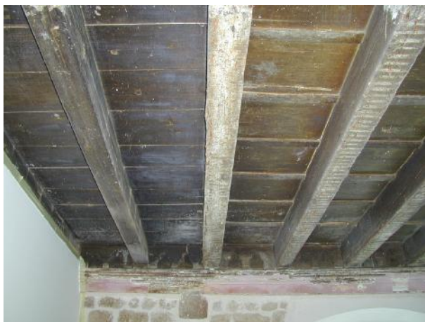
prije restauratorskih radova