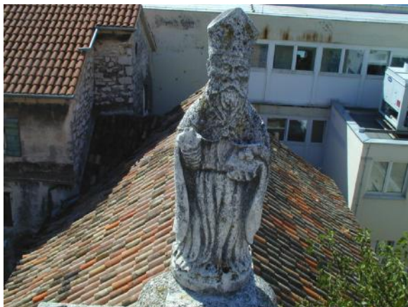
Kip sv. Nikole prije restauracije

Vrijednost donacije: 32.000 Kn (4.350 Eura)