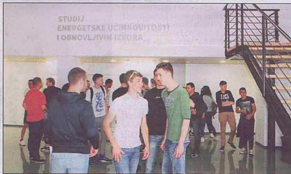
STUDIJ ENERGETIKE prvi je sveučilišni studij u Šibeniku

TRENUTAČNO U ŠIBENIKU STUDIRA 1150 REDOVITIH STUDENATA, A NJIH 837 IMA PREBIVALIŠTE IZVAN MJESTA STUDIRANJA