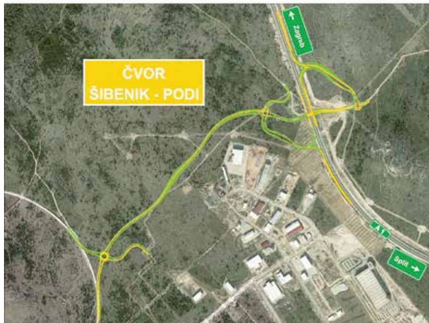
Projekcija čvora Šibenik - Podi

op.a.) raspisati natječaj za izvođača radova na izgradnji priključka zone Podi na autocestu. Procijenjena vrijednost radova, prema Planu nabave HAC-a tada je bila 35 milijuna kuna, plus 900.000 kuna za nadzor i koordinaciju realizacije projekta, a planirani rok za izgradnju 15 mjeseci. Itaj je rok prošao i bilo je jasno da od početka gradnje spoja u 2020.-oj nema ništa. No, o potrebi njegove izgradnje govori(lo) se i dalje. Na sastanku s ministrom mora, prometa i infrastrukture Olegom Butkovićem , koji je održan 23. rujna prošle godine u uredu šibensko-kninskog župana Gorana Pauka , a na kojem je bio i gradonačelnik Šibenika Željko Burić , razgovaralo se o projektima cestovne infrastrukture na području županije. Bilo je riječi o projektima koji su u tijeku ili su u fazi projektne dokumentacije te među njima i o spoju