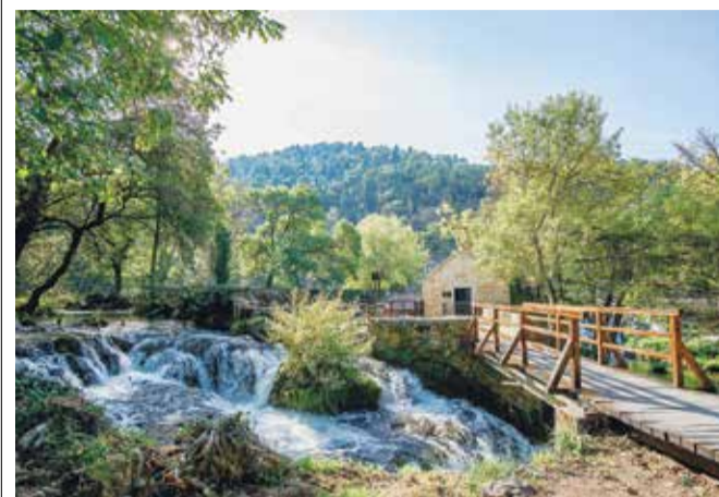
Promotivna akcija u NP-u Krka

od devet mjeseci. Inače, ukupna vrijednost projekta "Hrvatski centar koralja Zlarin" iznosi 24.127.147,50 kuna, a partneri su na njegovoj provedbi Javna ustanova za upravljanje zaštićenim područjima i drugim zaštićenim dijelovima prirode Šibensko-kninske županije "Priroda", Turistička zajednica Zlarin i Udruga za zaštitu prirode i okoliša te promicanje održivog razvoja "Argonauta". Projekt je sufinanciran sredstvima Europske unije u sklopu Operativnog programa "Konkurentnost i kohezija 2014. – 2020." ● ŠIBENSKI.HR