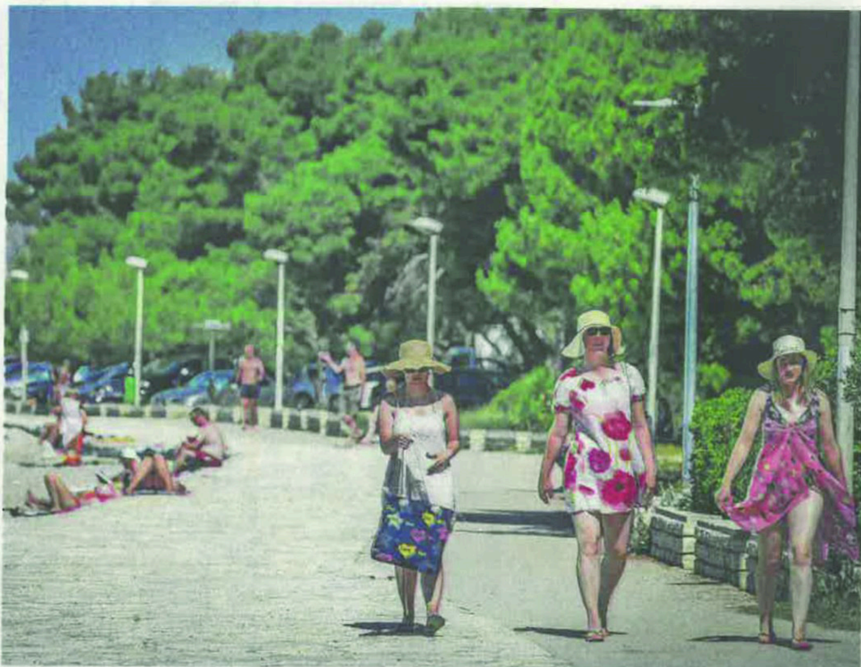
Jadrija će dobiti brojne nove sadržaje

Na svima će biti izmijenjena podloga, ograde i rasvjeta, a bit će mjesta i za tribine. U sklopu cijele zone planirana je