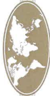
President, Rotary International