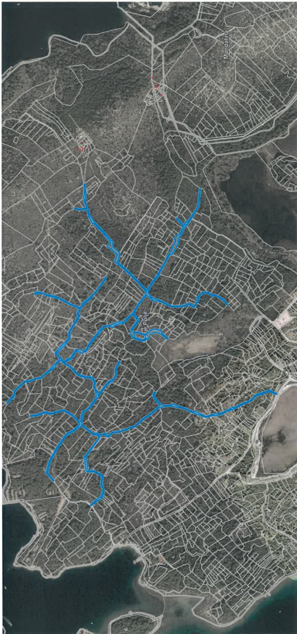
NC ZABLAĆE 113 5404/1 K.O. Donje Polje